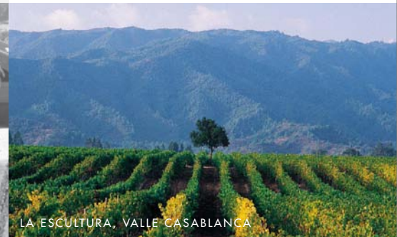
LA ESCULTURA, VALLE CASABLANCA